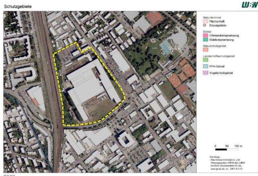
Abbildung 2 In der Umgebung des Planungsgebietes (gelb hervorgehoben) liegen keine Schutzgebiete.