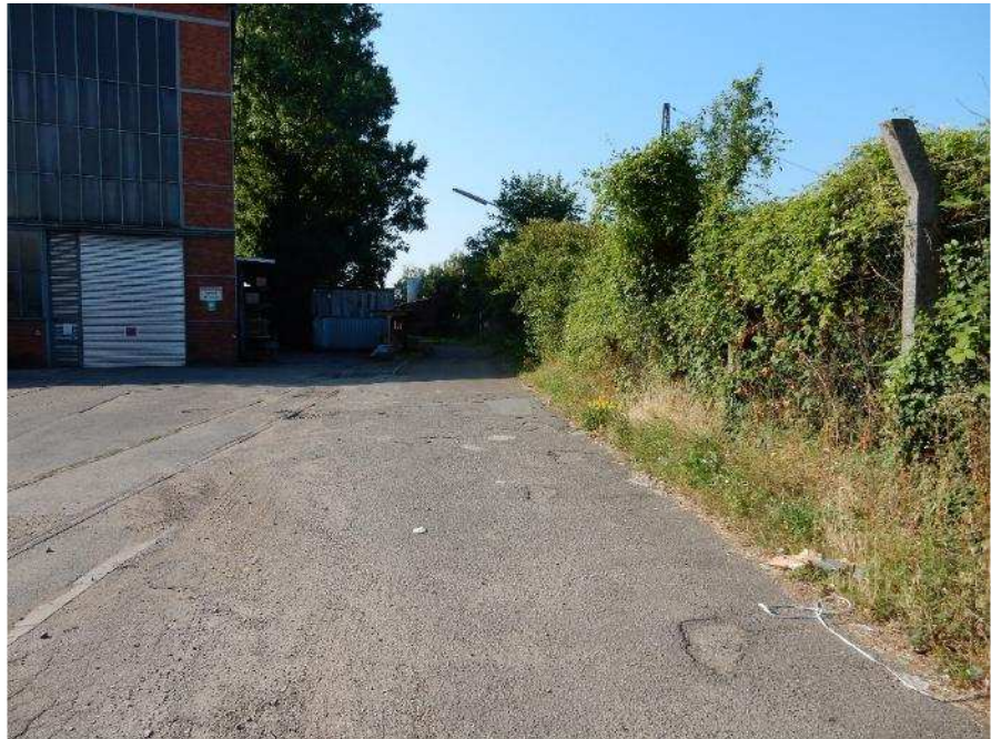
Foto 29: Im Bereich der Sauerstoffanlage (rechts im Bild) und der Entsorgungseinrichtung für Emaille-Rückstände (links im Bild) verbreitert sich der Grünstreifen etwas.

Foto 28: Grünstreifen zwischen Zufahrtsstraße Pfaudler (Bildmitte) und Gehölz auf dem Bahngelände (rechts hinter dem Zaun, im Bild ein Zaunpfosten aus Beton).