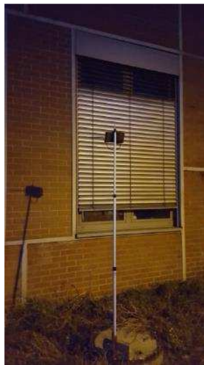
Foto 43: Potentiell für die Zwergfledermaus geeignetes Spaltenquartier an den im Untersuchungsgebiet befindlichen Gebäuden mit in unmittelbarer Nähe aufgestelltem akustischen Aufnahmesystem zur Kontrolle ausfliegender Tiere.

Foto 42: Potentiell für die Zwergfledermaus geeignetes Spaltenquartier an den im Untersuchungsgebiet befindlichen Gebäuden mit in unmittelbarer Nähe aufgestelltem akustischen Aufnahmesystem zur Kontrolle ausfliegender Tiere.