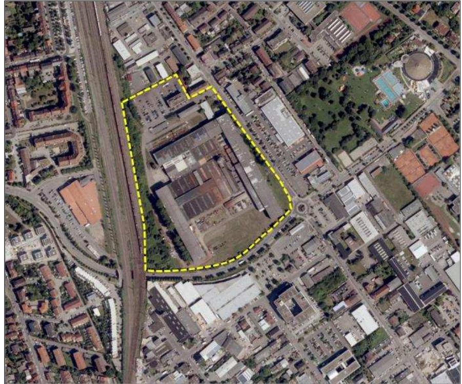
Abbildung 1 Pfaudler-Areal in Schwetzingen

2017 wurde durch den Eigentümer der Pfaudler Werke in Schwetzingen, die Deutsche Beteiligungs AG, beschlossen, das Gelände des Stammwerks am Standort in Schwetzingen an die Epple Hausbau GmbH in Heidelberg zu veräußern und den Produktionsstandort nach Waghäusel zu verlegen. Die Epple Hausbau GmbH plant, für das Areal einen Bebauungsplan aufzustellen, um eine Wohnbebauung zu ermöglichen.