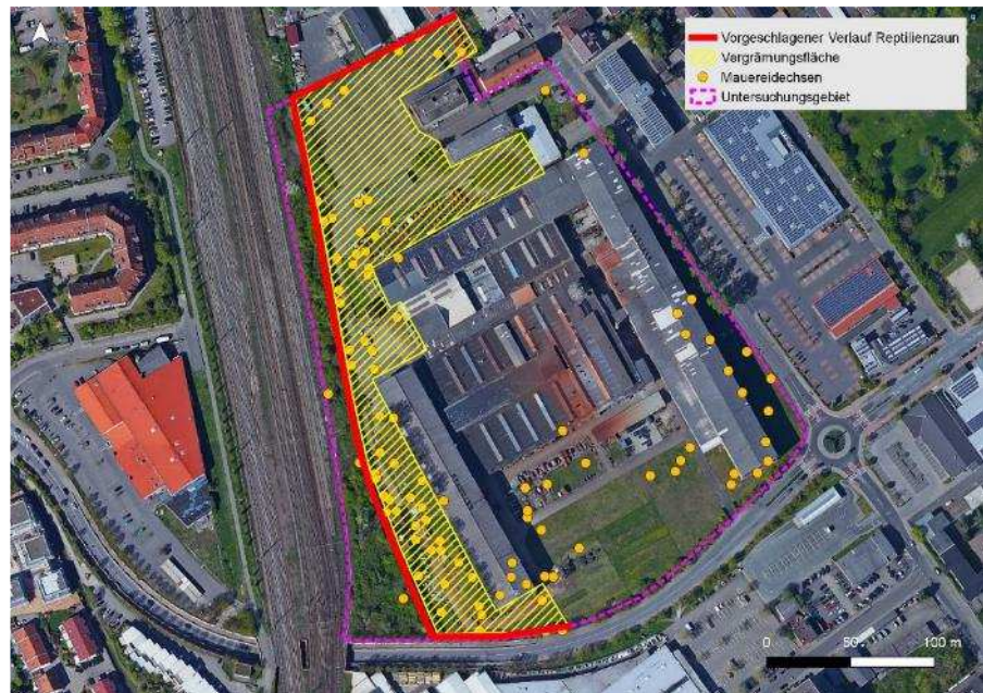
Abbildung 10: Durch eine Vergrämung der Eidechsen im gelb schraffierten Bereich (Entfernung Versteckstrukturen, Lenkung mit Reptilienschutzzäunen, ggf. Überschichtung besonders attraktiver Bereich mit Folien oder Holzhackschnitzeln) kann sich der Umsiedlungsaufwand drastisch reduzieren. Rot: vorgeschlagener Verlauf des Reptilienschutzzaunes

Das Gehölz kann durch Auflichtung und Eidechsenrefugien (Steinschüttungen) aufgewertet werden.