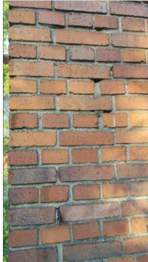
Foto 42: Potentiell für die Zwergfledermaus geeignetes Spaltenquartier an den im Untersuchungsgebiet befindlichen Gebäuden mit in unmittelbarer Nähe aufgestelltem akustischen Aufnahmesystem zur Kontrolle ausfliegender Tiere.

Foto 41: Potentiell für die Zwergfledermaus geeignetes Spaltenquartier an den im Untersuchungsgebiet befindlichen Gebäuden: Spalten im Mauerwerk