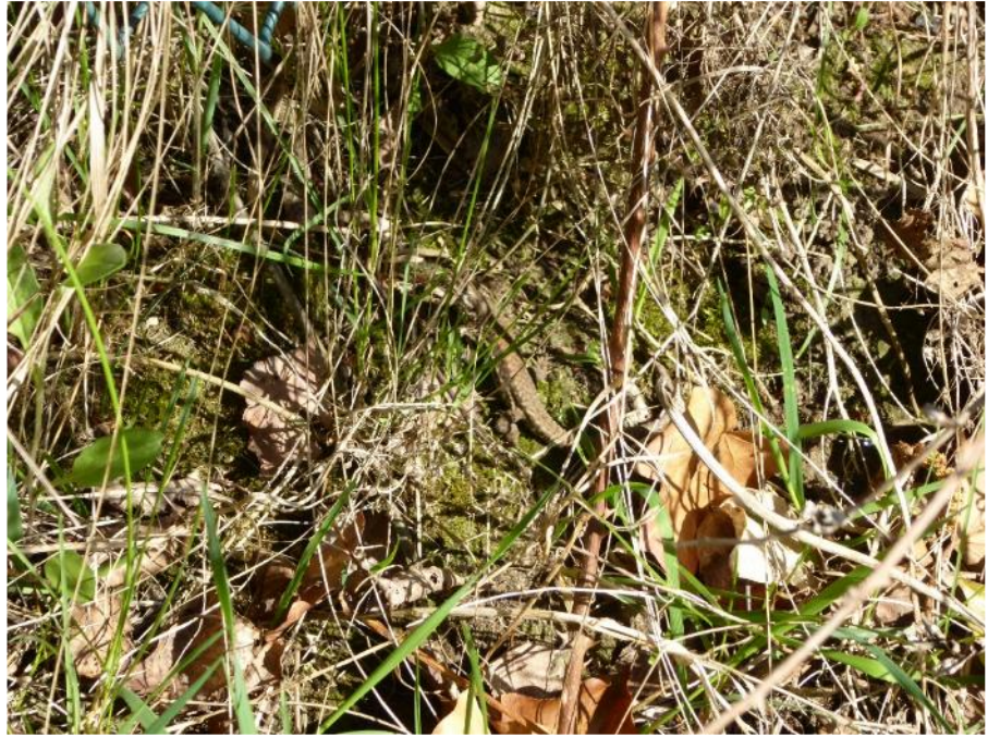
Foto 26: Mauereidechsen nutzen im Pfaudler-Areal vor allem die Versteckstrukturen, die sich ihnen auf den Materiallagerflächen bieten.

Foto 25: Mauereidechsen besiedeln im Pfaudler-Areal auch Habitate, die klassischerweise von Zauneidechsen besiedelt werden.